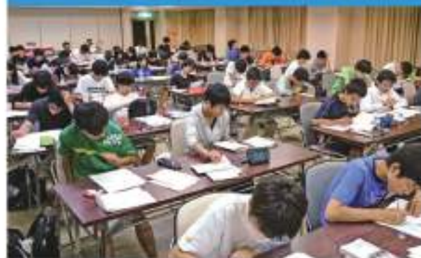
【上】月2回に増強された勉強合宿 【中】真剣なまなざしで授業に臨む特進Aクラス2年生 【下】部活動後に教員に質問する特進コースの生徒たち